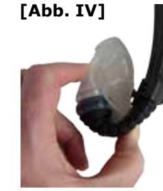
Abb. IV: Der loopel® wird vom Mundstück aus nach innen aufgerollt.